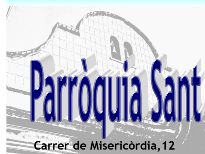
Carrer de Misericòrdia, 12